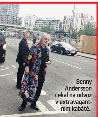
Benny Andersson čekal na odvoz v extravagantním kabátě..

ciální nizozemský fanklub zve skalní fanoušky na představení 26. května a že se Björn v rozhovoru zmínil, že se možná na tomto představení členové sejdou.