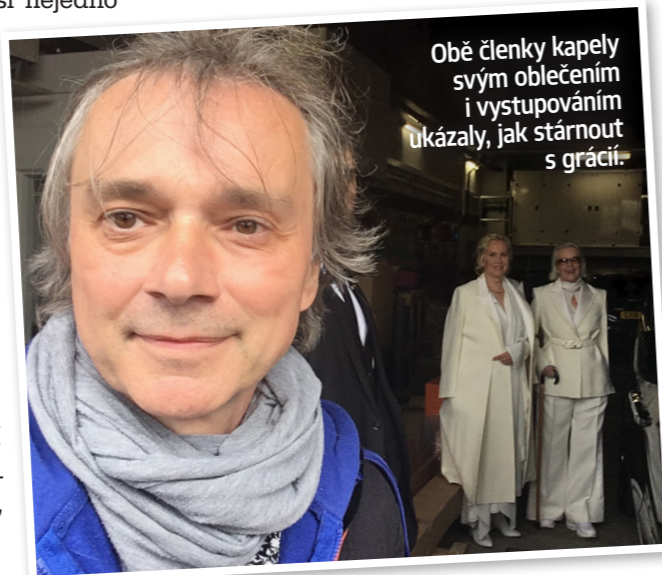
Obě členky kapely svým oblečením i vystupováním ukázaly, jak stárnout s grácií.

Napsal jsem prezidentce fanklubu e-mail o tom, co pro mě